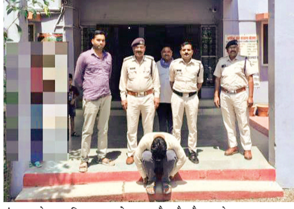
नंबर 01 के पास स्थित माल गोदाम बैठा है और अपने पास ब्राउन शुगर रखे हुए ग्राहक का इंतजार कर रहा